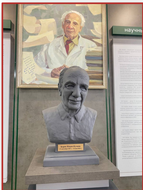
Открытие музея имени Б.И. Кузника стр. 3