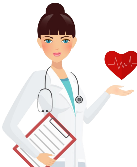
Международный день врача стр. 9